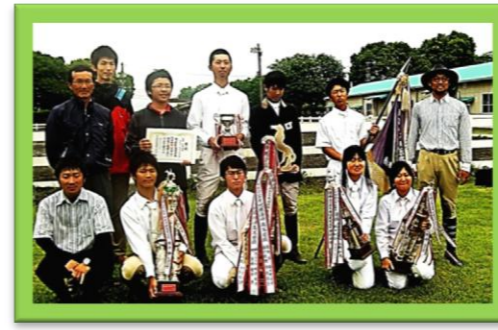
阿蘇清峰高校 阿蘇中央高校合同チーム 28年ぶり6度目の優勝!

平成23年度第39回熊本県高等学校総合体育大会馬術競技が菊池農業高等学校馬術競技場で6月3日(金)~5日(日)の3日間開催され阿蘇農業高等学校以来、28年ぶりに総合優勝を果たした。